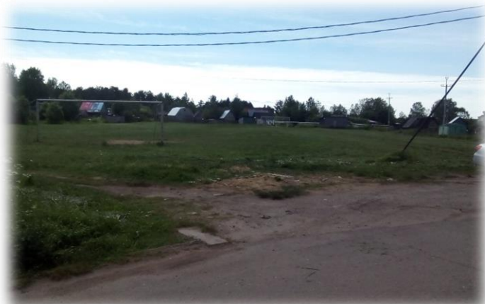
р.п.Большая Вишера (место отдыха для всей семьи)