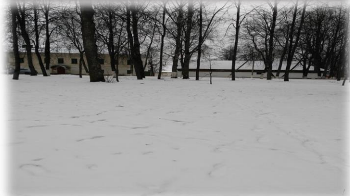
р.п Демянск (территория для детей и молодежи)