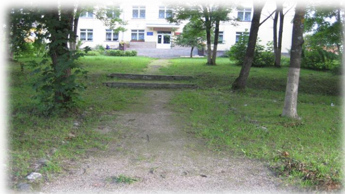
с. Мошенское (сквер)